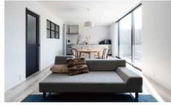
壁に囲われたプライベートテラスと螺旋階段のある家