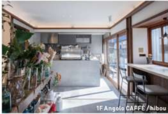
1F Angolo CAFE / hibou