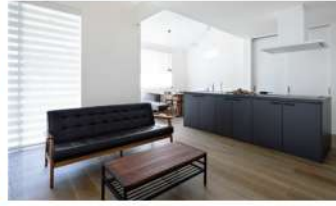
昼夜で異なる顔を見せるアイランドキッチンのある家