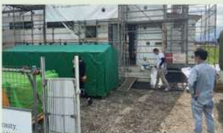
美しい現場は仕事もスムーズ