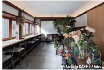
1F Angolo CAFE / hibou