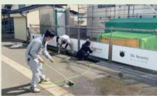
お掃除もすみずみまで