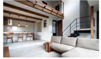
大人インダストリアルスタイルの家