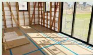
見えない部分の工事美しく！