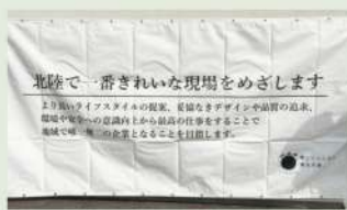
「北陸一番の美しさ」を宣言！

ことが目標です。地域の皆さまに支持され続ける企業であるために、家元の家づくりを支えてくれる職人さんや協力業者の皆さまとこれからも思いをひとつにし、どこよりも安全で美しい建築現場をめざしています。私たちの成長をぜひ見守ってください！