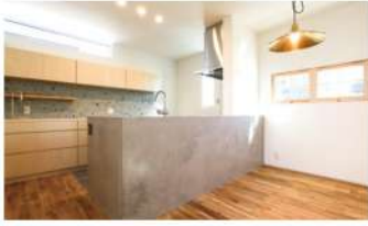
心ときめくオリジナル窓がある家