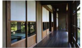
陰影が美しい家(町屋改装)