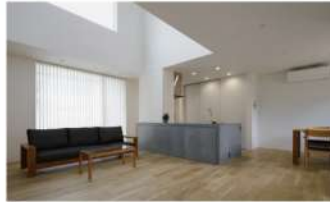
テラスポーチと吹抜のある家