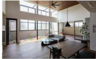
カーテンがいない平家の家