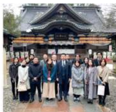
石川スタッフ「尾山神社」

金沢スタッフは尾山神社へ、富山スタッフは日枝神社へお参りました。ご祈禱してもらい、コロナが早く収束するよう祈願。今年もいい家づくりのお手伝いができるよう、気持ちを新たにしました。