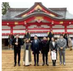
富山スタッフ「日枝神社」